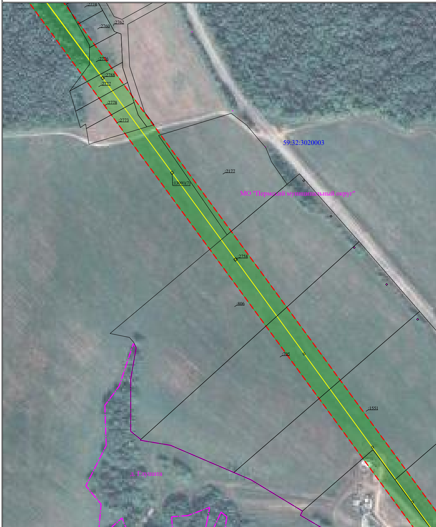
Схема расположения границ публичного сервитута для эксплуатации объекта ВЛ-35 кВ отпайка на ПС Скобелевка ц.1.2 ОТ ВЛ-35 КВ «ТЭЦ-13» - Заозерье ц.1.2